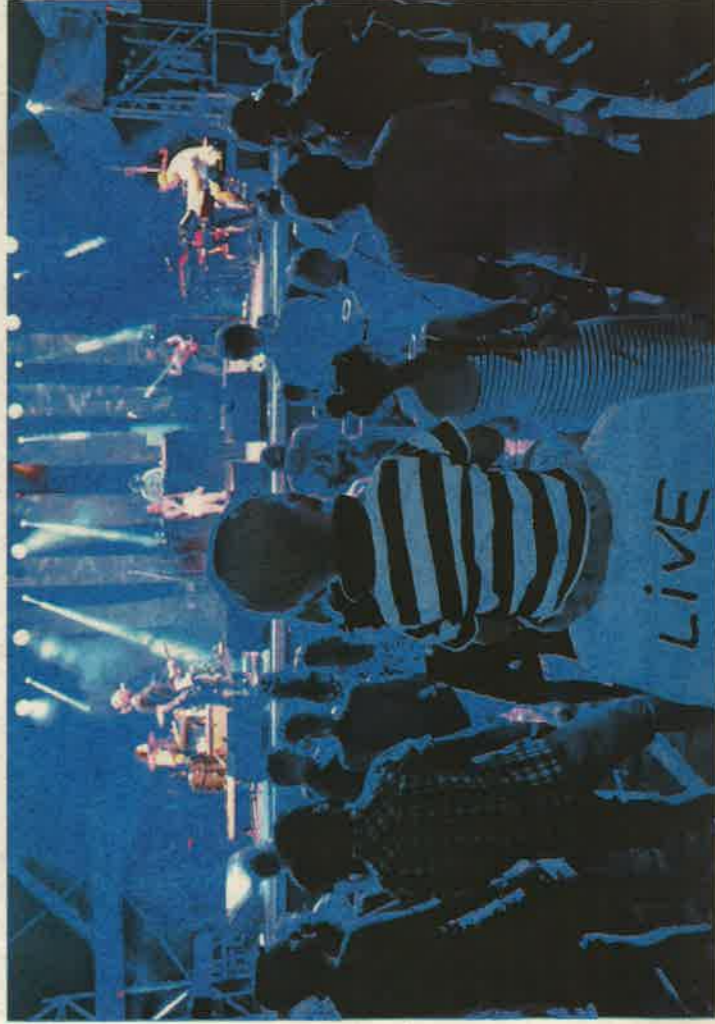
Négy színpadon húsz koncertet tartottak a dzsessz balatonai fővárosában