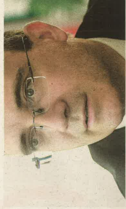
A mindennapi testnevelés bevezetése már eredményeket hozott. Idén újabb 20 tornaterem és 26 tanuszoda épült.

Minden demokratikus társadalom oktatási rendszerében elengedhetetlen, hogy a lakosság felelőssége megjelenjen, amikor az ország védelmi képességéről van szó – mondta lapunknak adott interjújában Maruzsa Zoltán köznevelési helyettes államtitkár a hazafias és honvédelmi nevelés tervezett átgondolása kapcsán. Fontosnak nevezte, hogy az iskolai évek alatt szó essen az ezzel szorosan összefüggő hazaszeretetről. Ebben nincs semmi ördögötöl való. Beszélt arról is, hogy már érezteti a hatását a kötelező testnevelésórák számának növelése: a Magyar Diáksport Szövetségs által végzett mé-