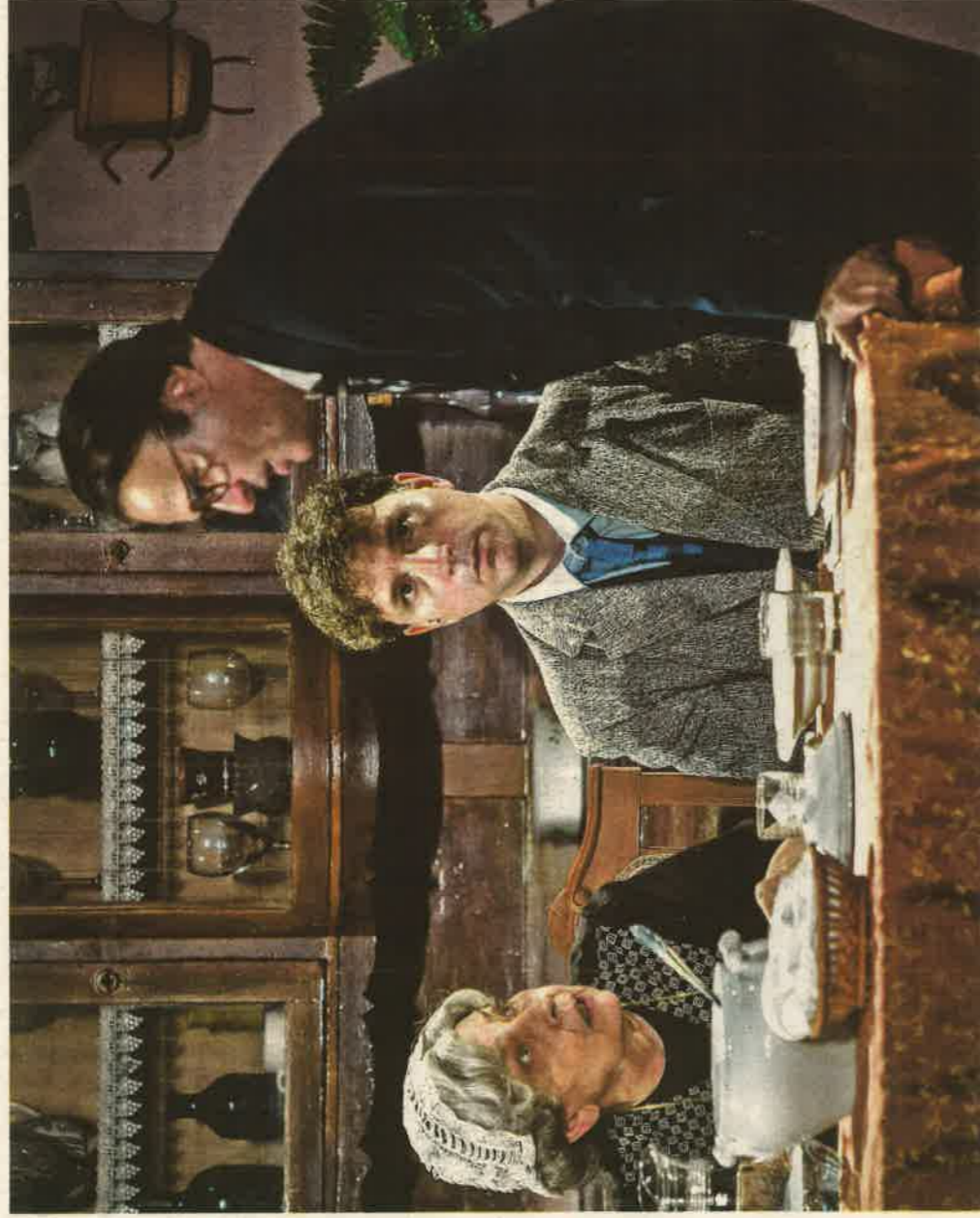
A csúcsjelenet, az ökörködéssel szétvert vasárnapi ebéd valóságos burleszkszimfónia

nyi a párbajtőr, az orvos (temetkezési vállalkozót mégse, az drágább) meg a taxi (mert villamossal mégis zsenátdadament). Ő az, akinek görbe tükrében minden férfi megláthatja és képen röhögheti saját életközépi valóságát. Ne feledjük: a bohóckodás fundamentu-