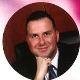
Balaicz Zoltán, Zalaegerszeg polgármestere

A település 1885-ös, rendezett tanácsú várossá nyilvánításának évfordulóját megelőzően máris invitálják a szervezők a kikapcsolódásra vágyó polgárokat a VII. PÁLINKA ÉS MANGALICA MAJÁLIS RENDEZVÉNYÉRE: ÁPRILIS 28. ÉS MÁJUS 1. KÖZÖTT újra a gasztronómiáé és a koncerteké lesz a főszerep a Zalakerámia Sport- és Rendezvénycsarnokban, illetve az intézmény környékén, tájékoztatott előljáróban Balaicz Zoltán, Zalaegerszeg polgármestere.