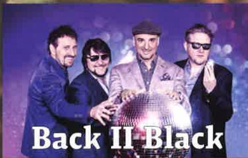
Back II Black