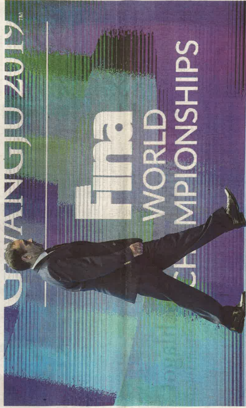
Lelépés. Az egykori médiavállalkozót felbujtóként elkövetett emberléssel vádolja az ügyészség

A Nemzetközi Úszósövetség és az Európai Úszó Liga a bíróságra vár