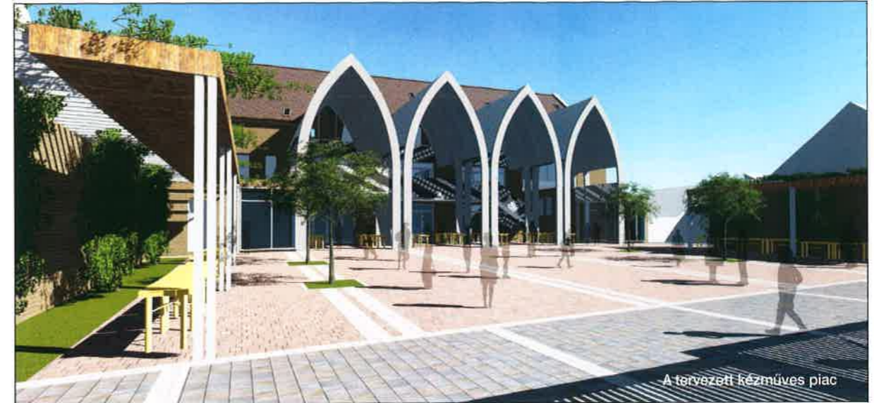
A tervezett kézműves piac

Nagy lehetőségek rejlenek a kertvárosi városrész melletti Alsóerdőben , melynek napközis táborát régóta szívesen használják a városlakók. Sajnos az elmúlt évtizedekben rossz állapotba került a létesítmény, így eljött az ideje, hogy megújuljon.