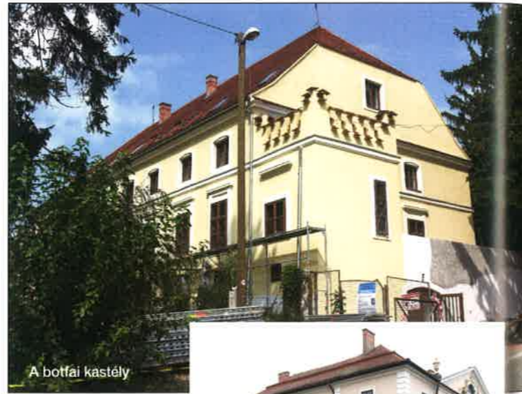
A botfai kastély