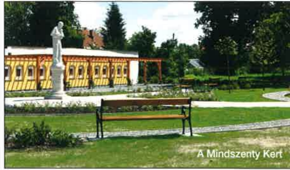
A Mindszenty Kert

Ugyancsak a Modern Városok Program részét képezi a Mindszenty József (a nagy építető Zalaegerszeg 1919-1944 közötti apátplébánosa volt) nevét viselő városrehabilitációs csomag. Bár Zalaegerszeg nagy történelmi múltra tekint vissza, sajnos más, szerencsésebb városokhoz képest nekünk nagyon kevés építészeti emlékünk maradt az elmúlt századokból. Ami van, azt őrizni és vigyázni kell.