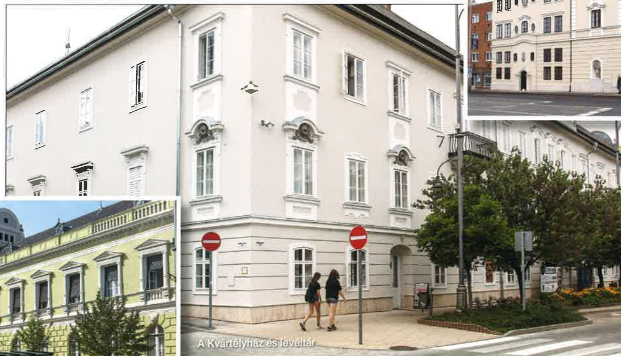
A Kvártélyház és levéltár