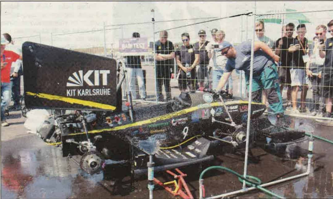
Vízest a rajt előtt.

FORMULA STUDENT EAST, MÁSODSZOR ZALAEGERSZEGEN