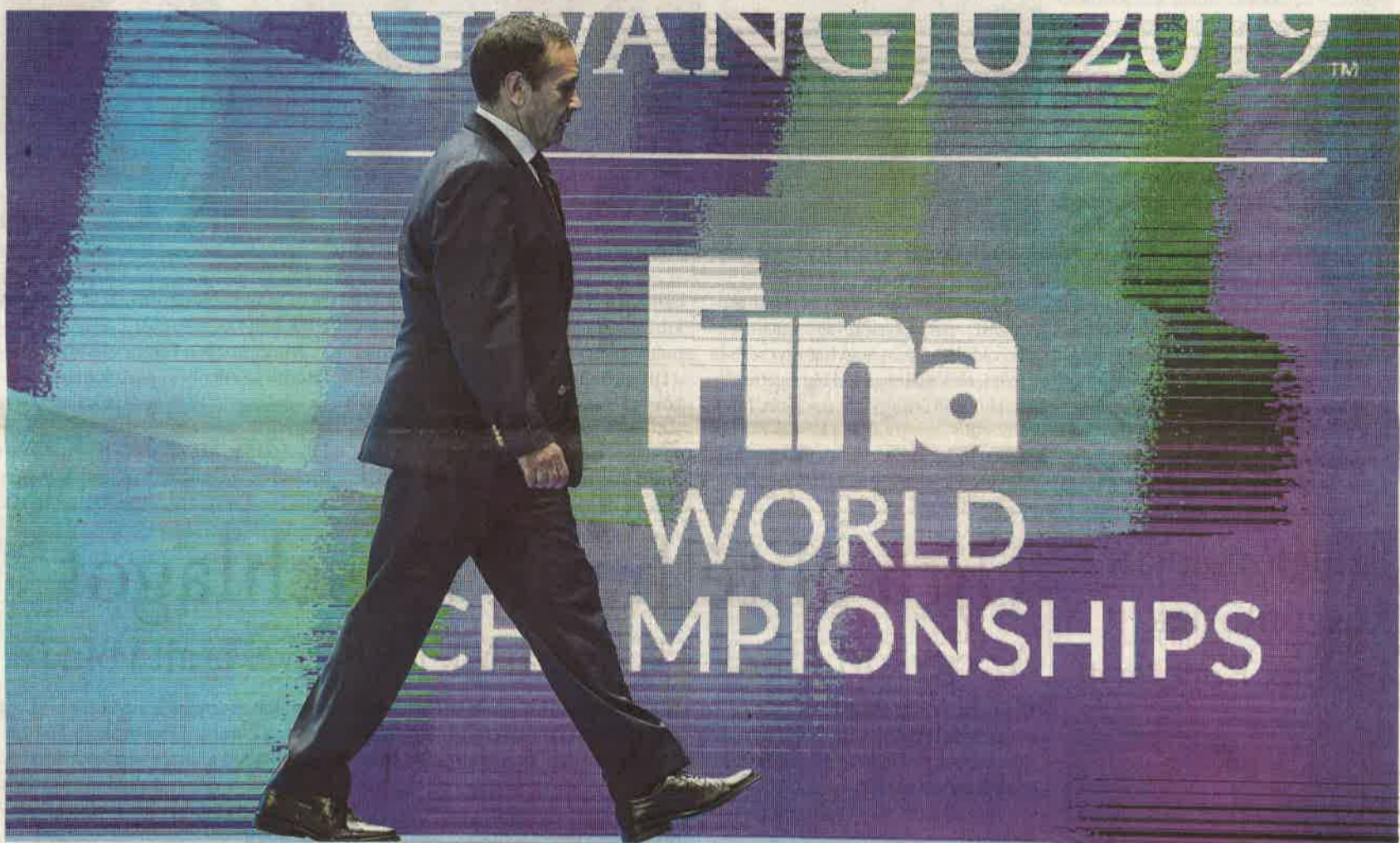
Lelépés. Az egykori médiavállalkozót felbujtóként elkövetett emberöléssel vádolja az ügyészség

A Nemzetközi Úszósövetség és az Európai Úszó Liga a bíróságra vár