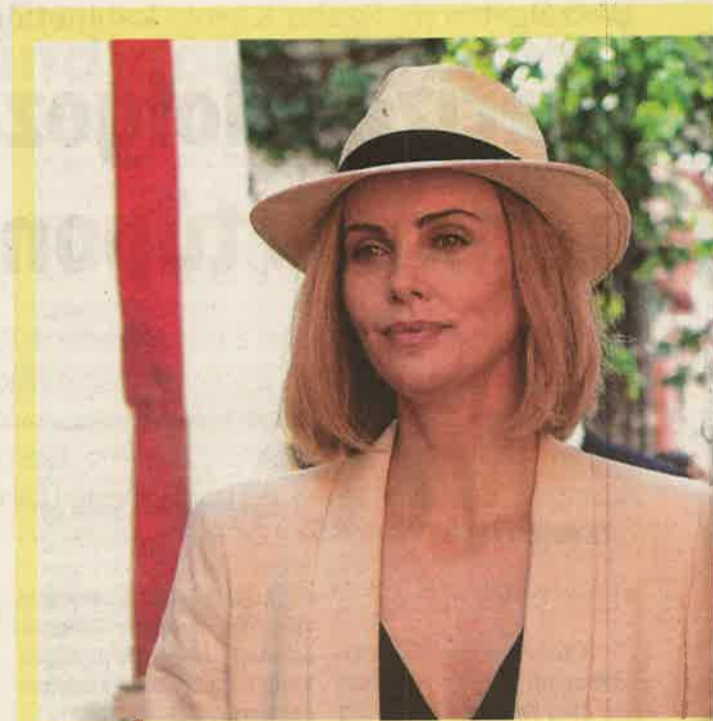
A Csekély esély című magyarul beszélő, amerikai vígjátékot mindkét zalaegerszegi színházban látható.

HALAK: Az élet több területén választás elé kerül. Mérlegeljen alaposan, próbáljon meg több szempontból is megközelíteni egy-egy kérdést! Tanuljon meg nemet mondani! Ne akarjon mindenkinek megfelelni.