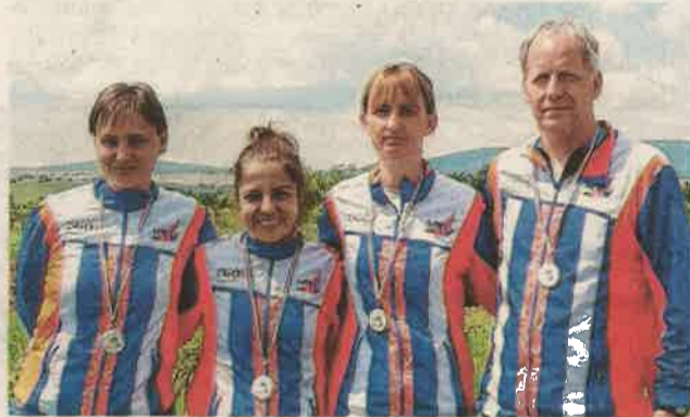
A ZTC senior csapata éremmel térhetett haza az országos középtávú és váltóbajnokságról

A Veszprém megyei Öskü térségében, egykori katonai gyakorlóterület adott otthont a tájfutók idei országos középtávú és váltóbajnokságának, ahol több mint 1000 induló állt rajthoz.