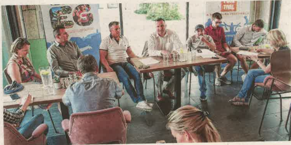
A Restart Fesztivál a sport és az egészséges életmód harmóniáját közvetíti a látogatók felé.

Szombaton megkezdődik az idei Restart Fesztivál versenysorozata. Ezúttal egy olimpiai kvalifikációs hegyi kerékpárverseny indítja el a már nemzetközivé érett sportrendezvényt. Júliusban pedig még az eddigieknél is szélesebb körű, informatívabb, izgalmasabb hétvégével várják a sportolni vágyó profikat és amatőröket. A részletekről hétfőn számoltak be sajtótájékoztatón.