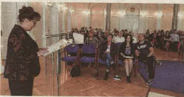
Tolvaj Márta alpolgármester az önkormányzat további támogatásáról biztosította a klubot.

Negyven évvel ezelőtt kezdte meg működését a Göcsej Alkoholmentes Klub. Az önszorgító szervezet pénteken a város dísztermében tartotta emlékülését.