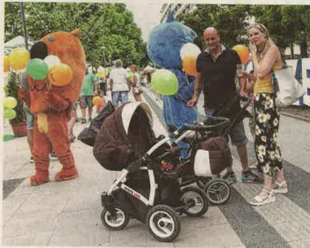
A több helyszínen zajló rendezvénysorozat valamennyi korosztály számára izgalmas, látványos és sokszínű programot kínál.

A Széchenyi téren népszerű együttesek – köztük a Köztársaság Bandája, a Góbé Zenekar, a Kaukázus, a 30Y – lépnek majd fel. Júni-