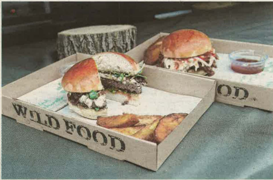
Szarvas- és vaddisznóburger csábította a látogatókat a vadászegyesület standjához