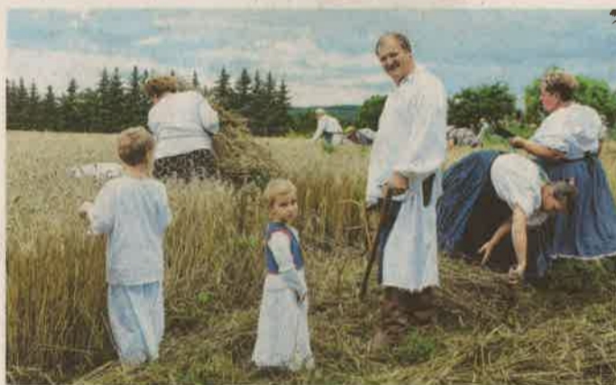
A Lakhegyi Daloskör bandájában az idősebb, gyakorlott aratók mellett az ifjak is bekapcsolódtak a munkába

KÖRKÉP Szombaton további rendezvényekkel folytatódott a Göcseji Dombórozó a programsorozatba bekapcsolódott településeken. Reggel a hagyományoknak megfelelően indult el Nován immár 31. alkalommal a kézikaszás arató- és cséphadarós cséplőverseny, ahol hivatalosan is megnyitották a szervezők és a támogatók az idei dombórozót. Az aratóverseny mellett számos kulturális és egyéb program is várta az érdeklődőket a hétvégén. KT Továbbiak: 3. oldal