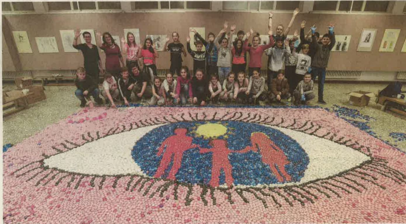
Több ezer kupakból készítették képet a Péterfy-iskola diákjai, hogy ingyen kirándulhassanak