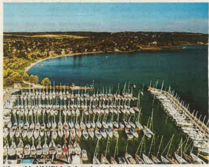
Vízparti hajókiállítás Balatonkenesén

Szeptember 6-8., Badacsony A régió egyik legimpozánsabb őszi rendezvénye, az