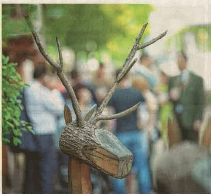
Ma kezdődik a vadpörköltfesztivál Egerszegen

A letenyei Béci-hegyen vasárnap 13 órától hegyi búcsút tartanak. A szentmise után a meghívott vendégek, köztük a Bazseva és a Magyar Állami Népi Együttes műsora színesíti a napot.