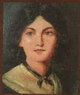
Emily Brontë a Windfell asszonya című romantikus regényében is megörökítette a helyet.

Ponden Hall könyvtára, amelyben Shakespeare művei is megváltak, nagyon fontos volt a Brontë nővérek számára, gyakran használták.