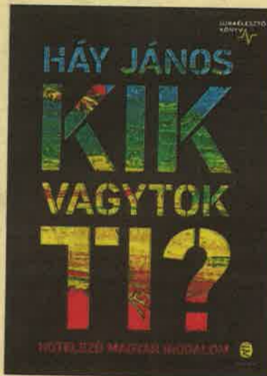
Izgalmas irodalomtörténeti utazás más szemszögből

– Minden, ami betű, az számomra érdekes, s nem csupán könyvek, de az újságok is; és lépést tartva a korral, a telefonomat, számítógépet is gyakran használom erre a célra, de természetesen amit nem tud semmi pótolni, az a kézzelfogható nyomtatott könyvek illata, tapintása, ami egész kisgyerekkorom óta elvárásom. Ötéves koromban már olvastam, ami leginkább annak köszönhető, hogy édesanyám történelmet is tanított akkor és az ötödikes történelem tantervben olyan izgalmas képek voltak, hogy mindenáron meg akartam tudni a mögöttes tartalmat is. Így hát autodidakta módon, a