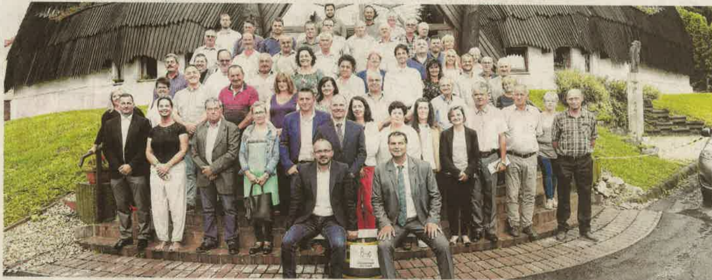
A fórum résztvevői a baki faluháznál, az első sorban Gyopáros Alpár kormánybiztos és Vigh László országgyűlési képviselő

Vigh László országgyűlési képviselő, miniszteri biztos szervezésében egyebek közt a Magyar Falu Program aktualitá- sairól juthattak információk- hoz a polgármesterek, akiknek Gyopáros Alpár, a modern tel- epülések fejlesztéséért felelős kormánybiztos tartott ismerte- tőt. A fórum előtt pedig sajtótá- jékoztatót szolt a két politikus a kistelepüléseket segítő pro- gramról. Folytatás: 4. oldal.