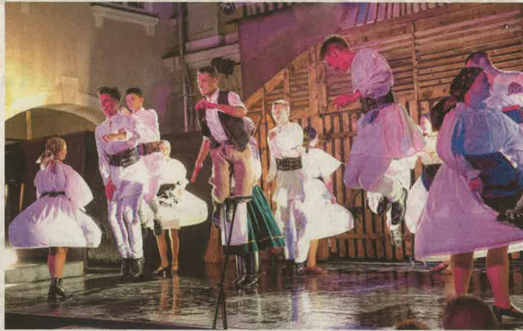
A Zalai Táncegyüttes előadásába sajnós beleszólt az eső