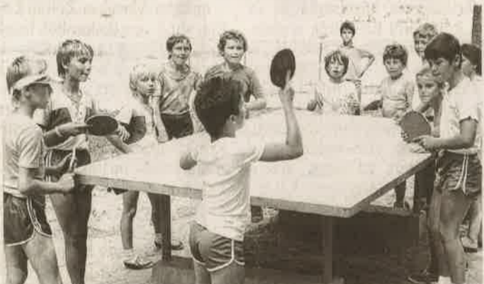
Pingpongozó gyerekek 1989 augusztusában

ZALAEGRSZEG Lapunk archívumából régi nyarakat idéző képösszeállítással jelentkeztünk a 12. oldalon, Múltidéző rovatunkban. A megyeszékhelyi napközis tábor nyolc-