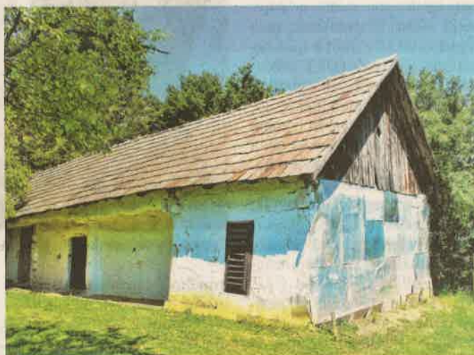
Még jó állapotban lévő esőbeállós tetejű pince

ZALASZENTMIHÁLYFA A Perjászlói-hegy a Dobronhegyi tetőről nyugat felé nyújtózkodó, völgyet szegélyező két nagy dombvonulat egyike, a déli oldalon. Vele szemben, a völgy túlsó oldalán a párja, a Balásfai-hegy húzódik. A Dobronhegyi tetőről, a két hegy közötti völgyben, a megye egyik legszebb panorámája nyílik. A hegyi túra mégis keserűes, az idős emlékezetében hegyi kaszálók, termésüktől roskadozó gyümölcsfák, fondorukat hullató gesztenyefák jelennek meg. A valóság azonban egészen más képet fest. GYI Írásunk az 5. oldalon.