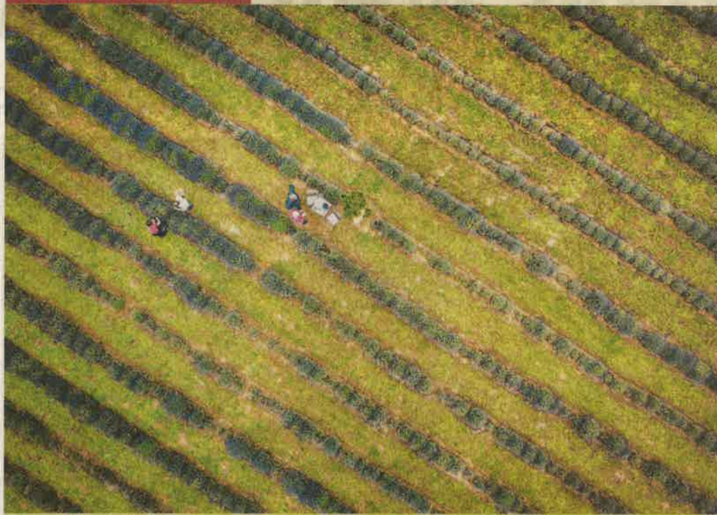
A levendula sokoldalúan, változatosan használható, finom illatú gyógy-, fűszer- és dísznövény. Európába a rómaiak hozták be, az ókorban a szépségápolás meghatározó növénye volt. A levendula nálunk már télálló növény, jóllehet eredetileg a mediterrán flórához tartozott, ma már mind több helyen találkozhatunk vele megyénkben is. Drónfelvételünk az egerszegi ültetvényről készült.