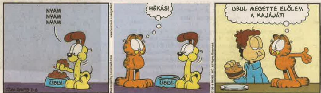
További képsorok olvashatók a Garfield magazinban és a Zseb-Garfield képregénysorozatban. www.garfieldmagazin.hu