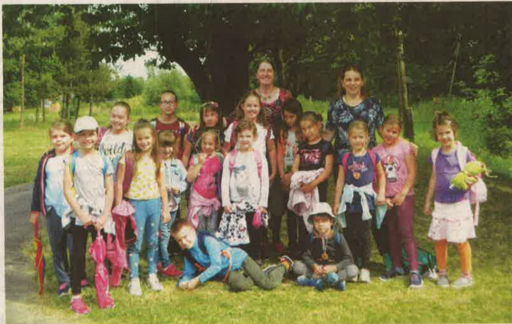
A zalaegerszegi falumúzeumban rendezett tábor résztvevőinek csoportképe

Az alkotó-fejlesztő metamorphoses meseterápiára épülő mesetáborban az egy-nyegy világgépet tükröző népmeséken keresztül a gyerekek megtapasztalhatták a világ működésének rendjét, s azt is, ha megfelelően kapcsolódnak ehhez az egységhez, akkor képessé válhatnak saját maguk, de akár az őket körülvevő