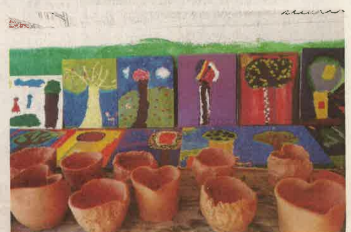
Szívbéli fazekas csuprok és „égig érő” rajzok

További izgalmas hírekért látogasson el ide: