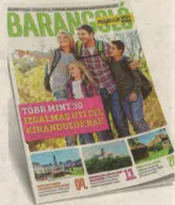
A kiadvány a zaol.hu oldalról már letölthető

ZH-INFORMÁCIÓ Az idei tavaszt meghatározó koronavírus-járvány és az azzal járó intézkedések mindenképpen a négy fal közé kényszerítettek, hiába érkezett meg a jó idő, elmaradtak a kirándulások, a szabadtéri programok. Nem csoda, hogy a nyár beköszöntére szinte kiéhezünk az élményekre, a barangolásra, amihez idén nagyon sokan belföldi úti célt választanak. Barangoló című digitális kiadványunk nekik igyekszik segíteni. A részletek Barangoló... cím alatt a 3. oldalon olvashatók.