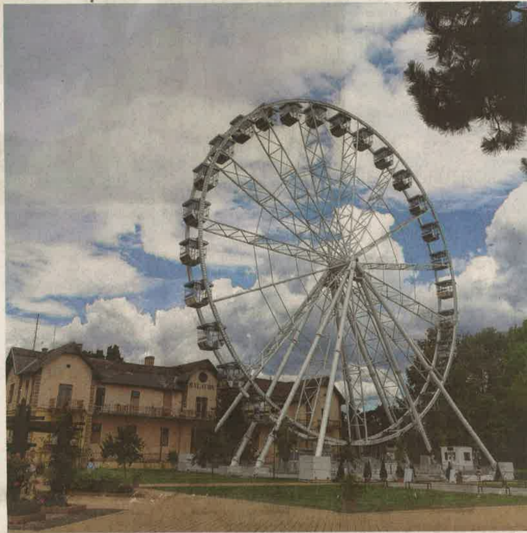
A harminc gondolában egyszerre 180 ember foglalhat helyet, akik az „utazás” csúcspontján ötven méter magasból láthatják a tavat és a város környékét

– Az óriáskerékkel egyedi látványosság került a városba, hiszen az ország egyik legnagyobb óriáskerékét építettük fel – emelte ki a polgármester. – Aki felszáll rá, olyan perspektívából csodálhatja meg a Balatont és Keszthely környékét, melyből eddig még nem láthatta mindezeket. Ez önmagában is nagy turisztikai vonzerő, és azt várom, hogy sok embernek okozzon majd örömet. A cikk Ötven méterrel... cím alatt, a 4. oldalon folytatódik.