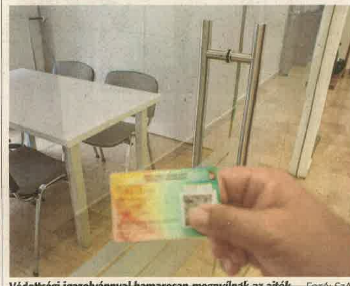
Védettségi igazolvánnyal hamarosan megvárják az aítók.