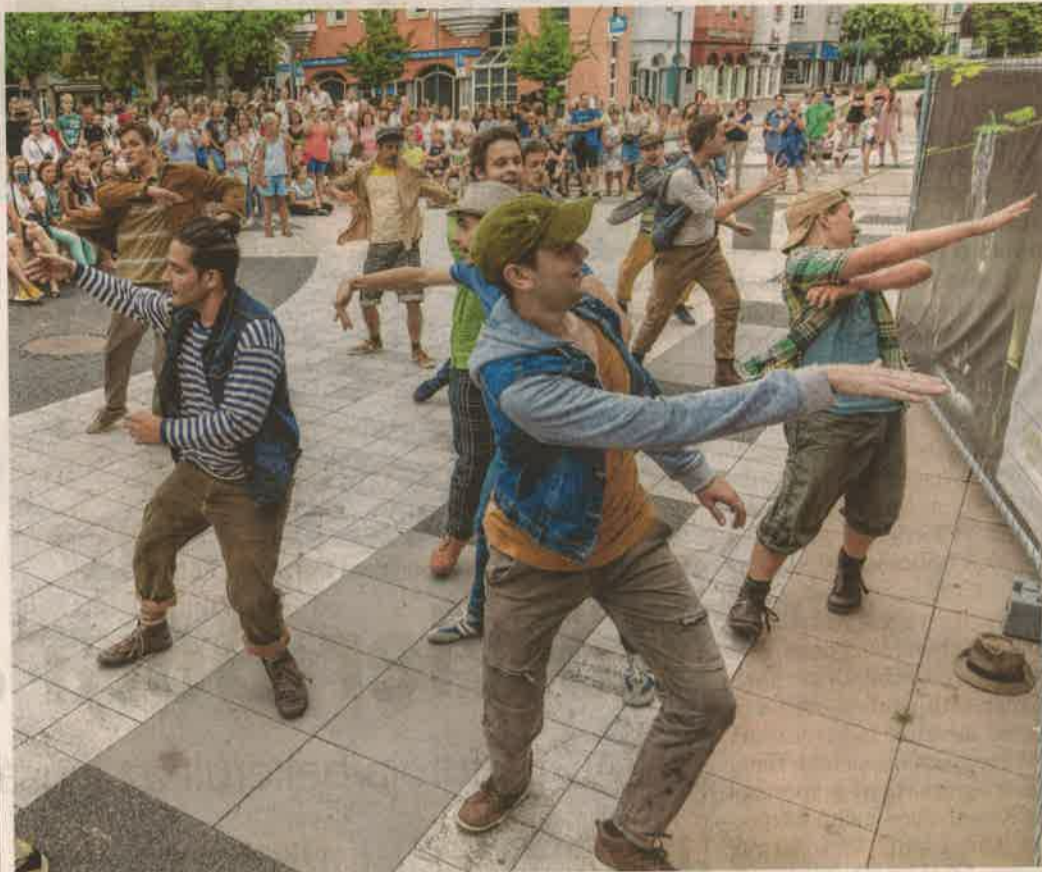
A Dísz téren idézték meg az előadás hangulatát

A Pál utcai fiúkat jövőre is láthatja a közönség