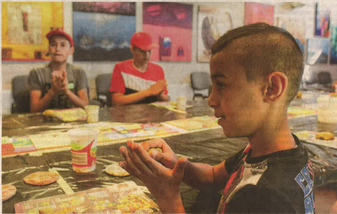
Agyaggal is dolgoztak a fővárosi átmeneti otthonból Zalába érkezett gyerekek

Hátrányos helyzetű gyerekek érkeztek Kendlimajorba