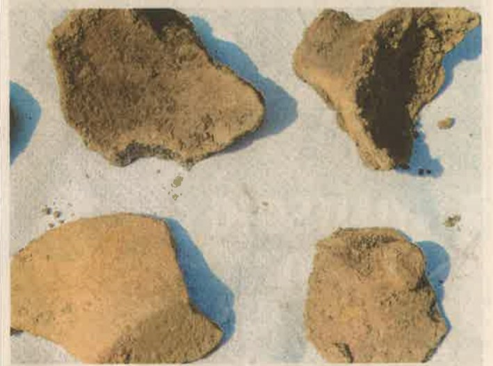
Cserépedények, fazekak maradványait találták

NAGYKANIZSA Dr. Száraz Csilla régész, a Thury György Múzeum igazgatója vezetésével zajlik az az előzetes régészeti feltárás, amely a kanizsai ipari parkon áthúzódó új út nyomvonalát kutatja.