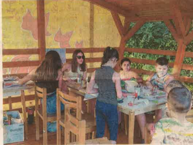
Rajzolni, festeni, ragasztani is lehetett