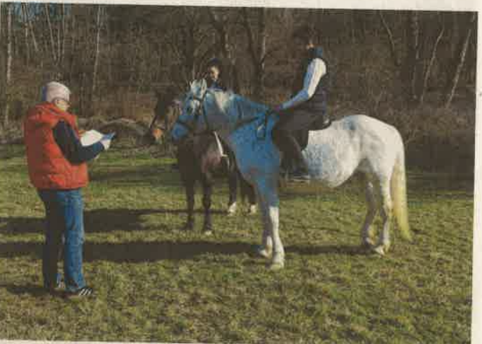
A kisfilmet Tompagábor Kornél rendezte