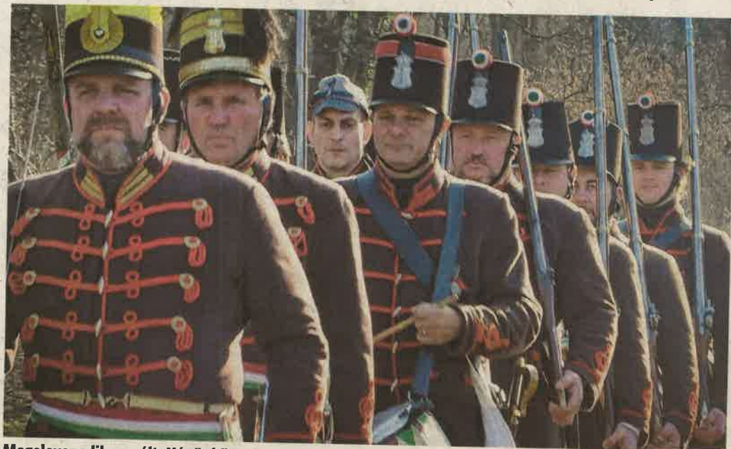
Megelevenedik a múlt. Képünkön a 47. Honvédzászlóalj Hagományőrző Egyesület tagjai

ZALAEGRSZEG Eldördül egy ágyú, majd felcsendül Bartók Allegro barbarója, a távolban pedig feltűnik két lovas. 1848-ban járunk, amikor Petőfi Sándor és a Tízek Társasága megfogalmazza „az ifjú Magyarország kiáltványát”, a 12 pontot.