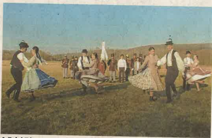
A Zalai Táncegyüttes négy párja szatmári táncokat adott elő