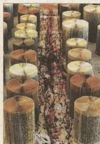
Az út – könyv installáció (2006)

– Meg is szenvedtem Szegeden az ábrázoló geometria szigorlatot – utal fejét csóválva az immár Magyarországon megszerzett rajztanári diplomára. Jövőre lesz 30 éve, hogy Zalaegerszegen telepedett le, a város tavaly Pro Urbe-díjjal