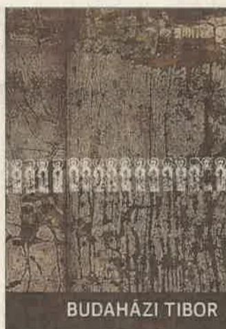
Az elegáns kötet címlapja

A művészeti gimnáziumban matematikából nem kellett érettségizniük