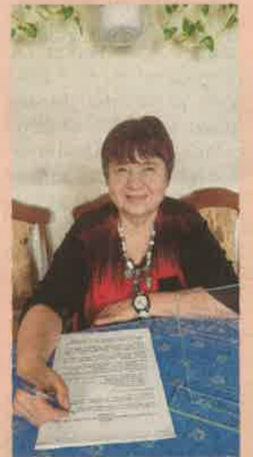
„Vérében van” mások megsegítése 9. OLDAL