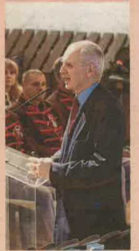
Dr. Hermann Róbert előadása 7. OLDAL