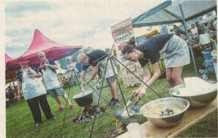
A Kvartélyház Kft.-nél felváltva főztek és sütöttek