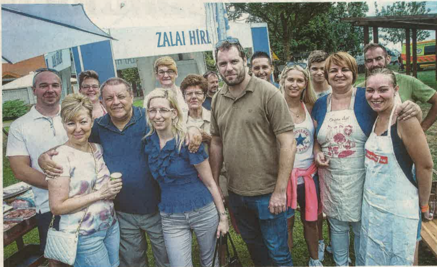
A Zalai Hírlap és a Zalaegerszegi 7 Nap közös csapata is kivette részét a játékonysági főzésből. Nagy sikere volt a bográcsos nyúlragunak és a grillezett húsonak. A zsűritől el is nyerte a csapat A grillezés királyai és királynői címet igazoló oklevelet