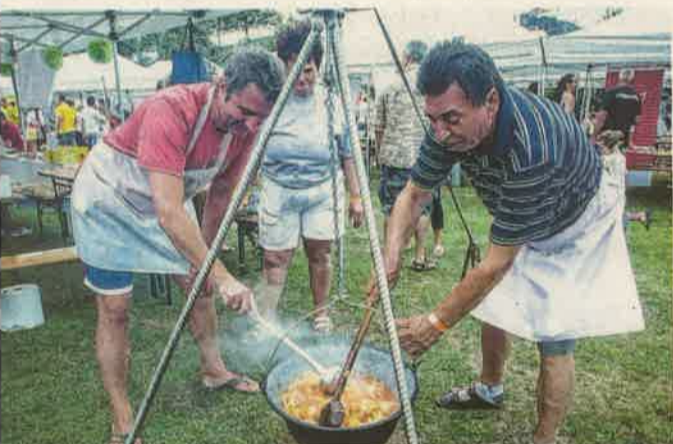
A főzserp a bográcsé volt, ami szinte minden közösségnél előkerült

A nap folyamán 2100 vendég fordult meg az AquaCityben, akik 932 ezer forintot fizettek belépőjegyre. A mindenkorban nagyobb számú, 64 főzőcsapat összes bevétele 1 millió 460 ezer forint volt, 44 cég pedig 3 millió 40 ezer forintot ajánlott fel (ez is rekord) a játékonysági célokra.