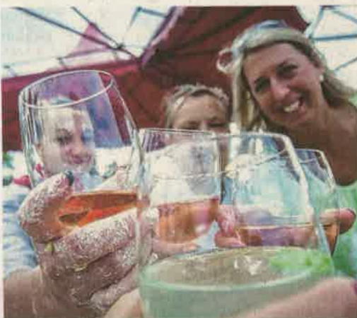
A csipetke szagztatása közben jutott egy kis idő koccintásra is az AquaCity csapatánál