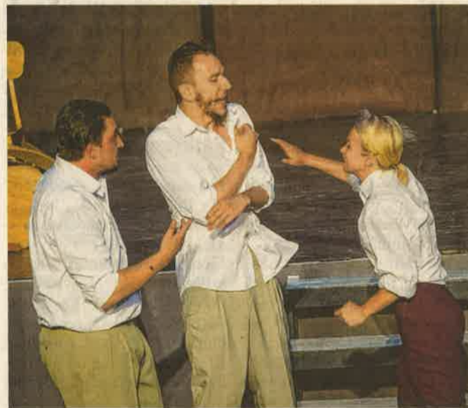
Jelenet a K2 Színház Mindenki Egerszegről című darabjából.

ZALAEGRSZEG Szombaton este a Mindenki Zalaegerszegről című rendezvény előadással lezárult az V. ZA-KO fesztivál, aminek a belvárosi Kvartélyház adott otthont.