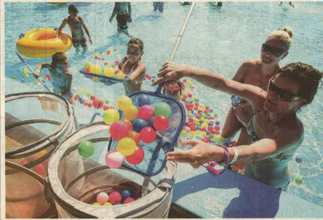
Vidám vízi játékok, mozgásra ösztönző feladatok várták a strandoló családokat.

A Zalai Hírlap játékos sportnapja az AquaCityben