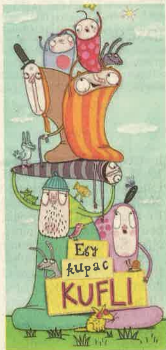
A kuflik a vászonra költöznek

Az Egy kupac kufli című filmből kiderül, hogyan töltik a kuflik a Bújócskázás Világnapját, minek öltöznek, ha nyáron szilveszteri jelmezbálba hívják őket, mit tesznek,