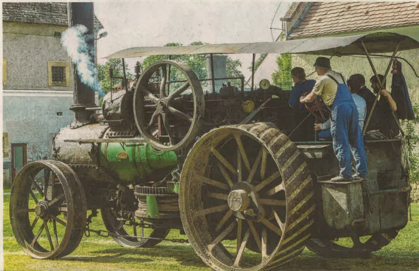
Fűtötték, olajozták, aztán beindult a kétgépes gőzeke egyik csörlős masinája, a látogatók nagy öröme