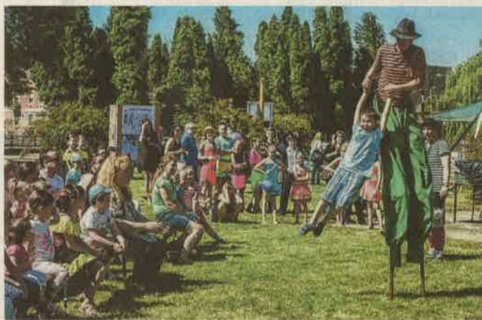
Új színpont: gólyalábások nyitották az egerszegi gyereknapot