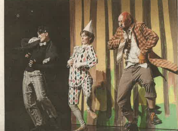
A Pinokkió című, gyerekeknek szóló táncelőadást kétszer is telt ház előtt adta elő a Bozsik Yvette Társulat.