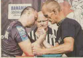
Zalai versenyző a szkander vb-n. 10.