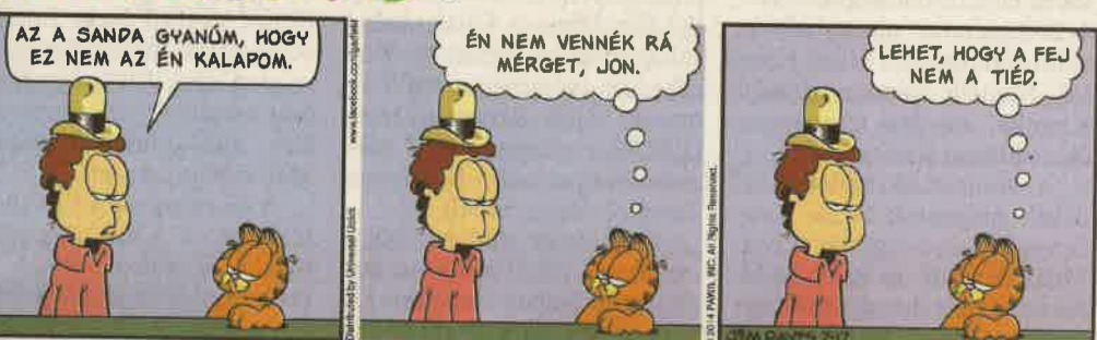
További képsorok olvashatók a Garfield magazinban és a Zseb-Garfield könyvsorozatban. www.garfieldmagazin.hu