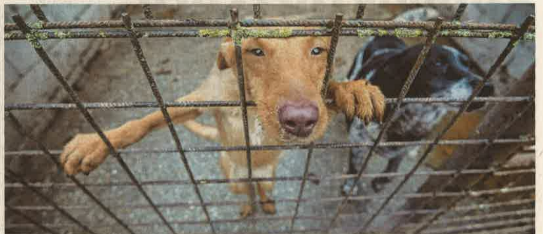
Sok kutya kerül ilyenkor a nagykanizsai állattenhelyre

Ebben az időszakban nem a szerelem heve vagy a szabadságvágy miatt szöknek meg leginkább a négylábúak. A petárdák és a tűzijátékok robaja rémíti meg őket. Egy körültekintő gazdi azonban meg tudja előzni a bajt. Biztonságos környezetben, esetleg némi gyógyszerrel orvosolható a probléma. Részletek: 4. oldal