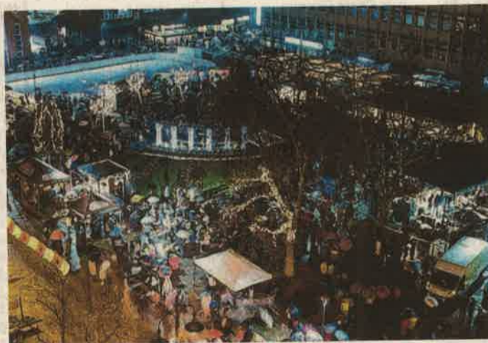
Idén is több ezren köszöntötték együtt az újévet a Dísz téren

Zene, tánc és jókedv két napon át a Dísz téren