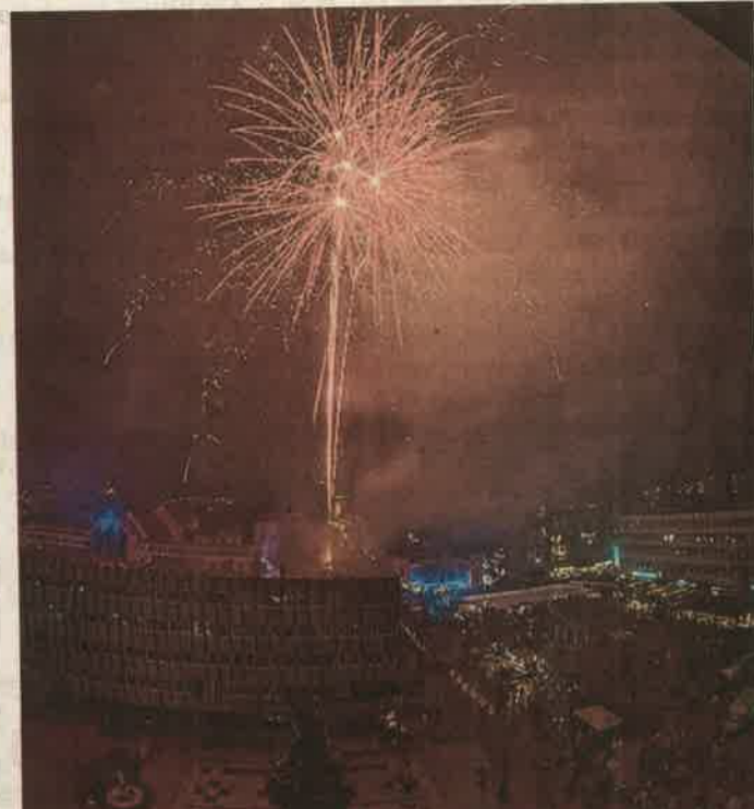
Az idei újévi tűzijáték egy pillanata a magasból

Jól halad a belváros turisztikai megújítását célzó Mindszenty-projekt, 9,5 milliárdos ráfordítással rövidesen elindulhat az új városi uszoda építése, 2,8 milliárdból megújul az alsóerdei szabadidőközpont, a göcseji hagyományok megőrzése jegyében jön létre a jelenleg közbeszerzés alatt álló helyi termékek piaca, megújul a Göcseji és a Falumúzeum, s 1,1 milli-