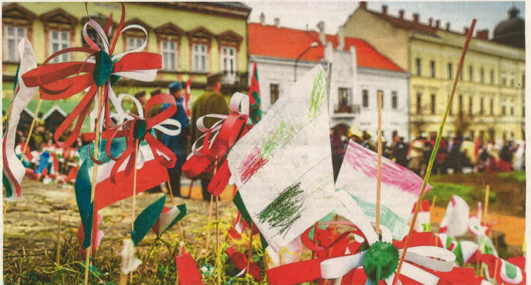
Városok és kistépelülések egyaránt készülnek a forradalom és szabadságharc évfordulójának köszöntésére. Felvételünk egy korábbi kanizsai rendezvényen készült.

Lentiben csütörtökön 15 órakor tartanak megemlékezést az 1848-49-es forradalom és szabadságharc évfordulóján az 1848-as emlékműnél. Ünnepi beszédet mond Vigh László , a térség országgyűlési képviselője, a műsorban az Arany János Általános Iskola és AMI tanulói szerepelnek.