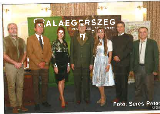
A vadászati konferencia résztvevői

méreteti ételét, klasszikus és újító recepteket egyaránt követve. Győztesként az Igaz Vadászok kerültek ki, valódi ételkölteményt varázsolva a zsűri elé.