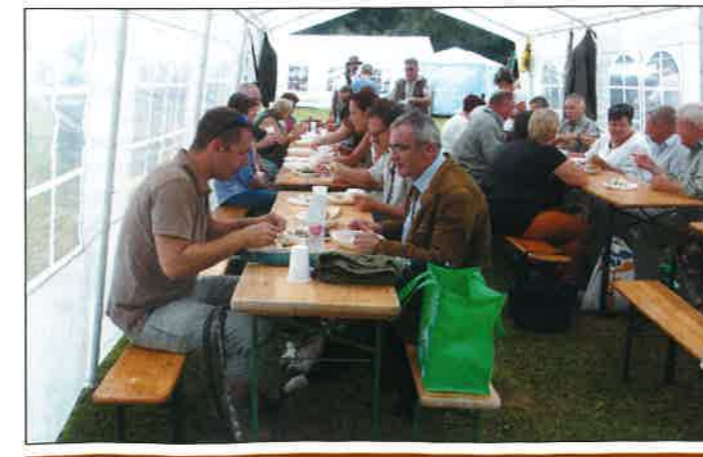
Vadászabéd a NIMRÓD VT-nél