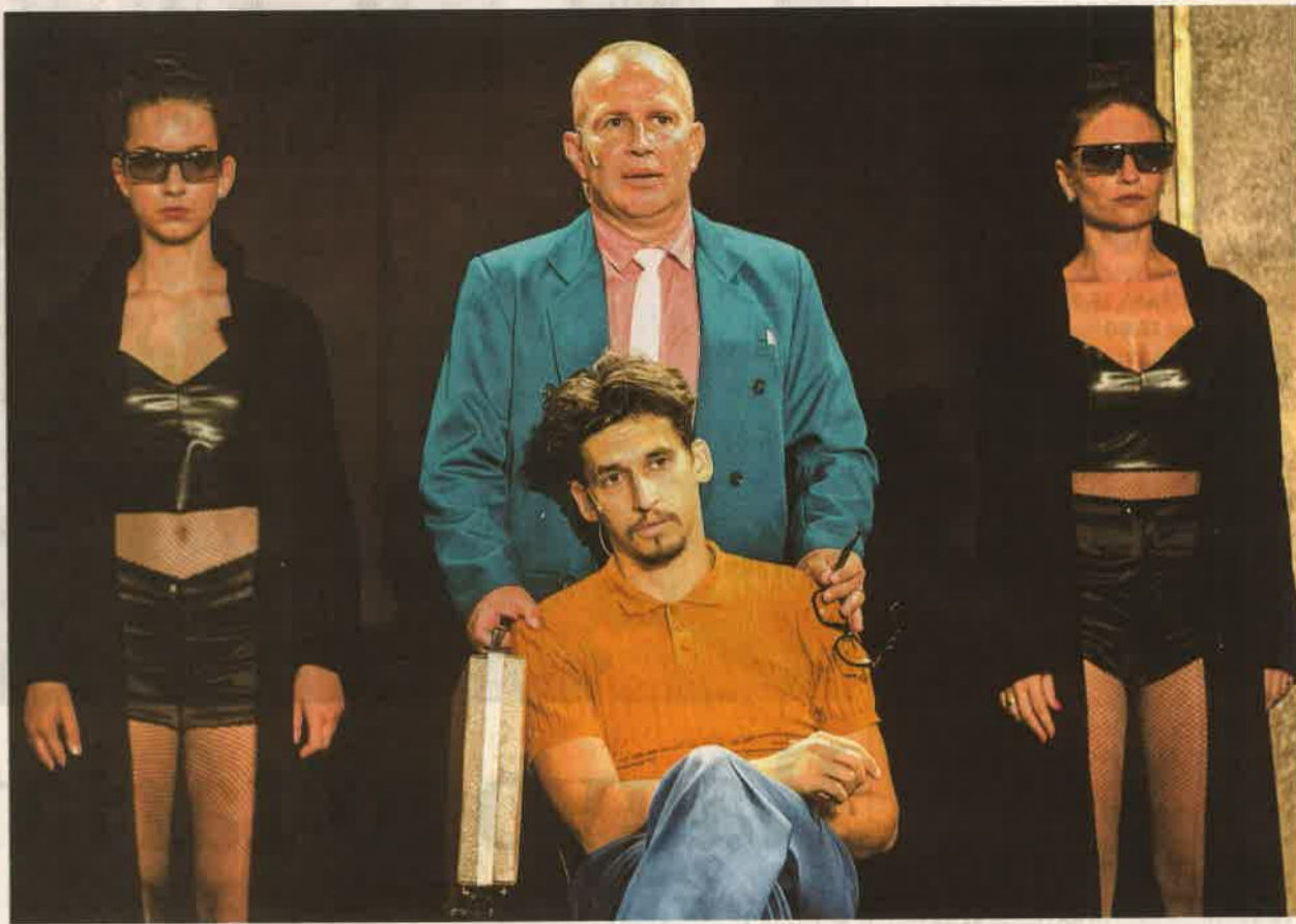
Az összhatás olyan, mintha a Monthy Python celebrált volna egy táncdalfesztiválba oltott freak show-t.