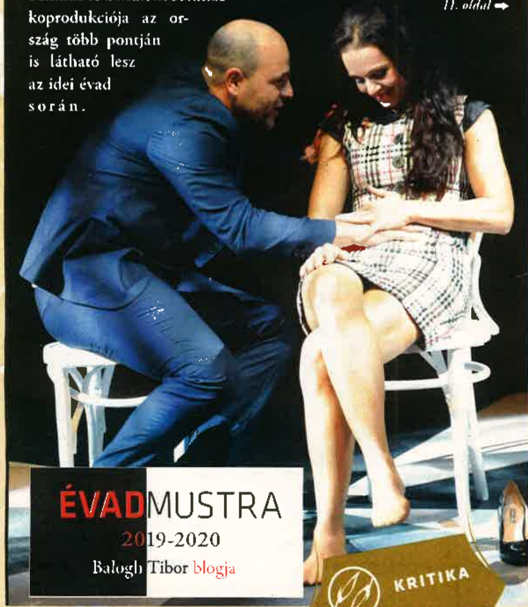
11. oldal →

ÉVADMUSTRA 2019-2020 Balogh Tibor blogja