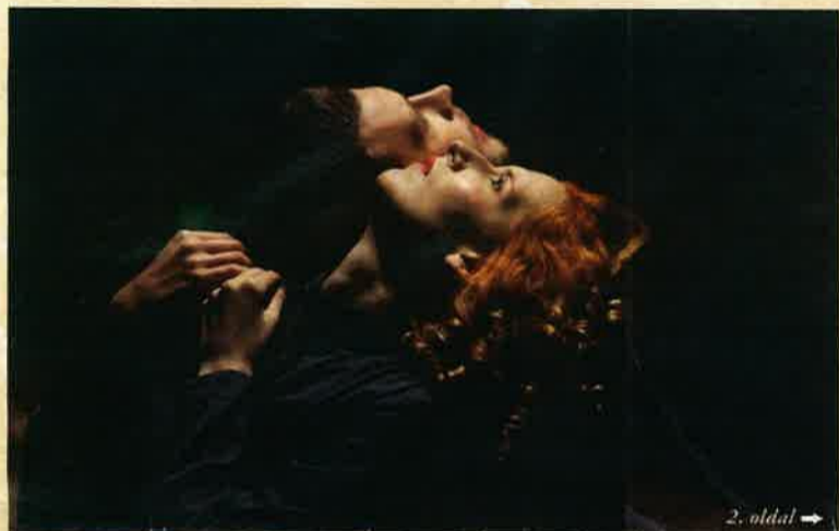
2. oldal →