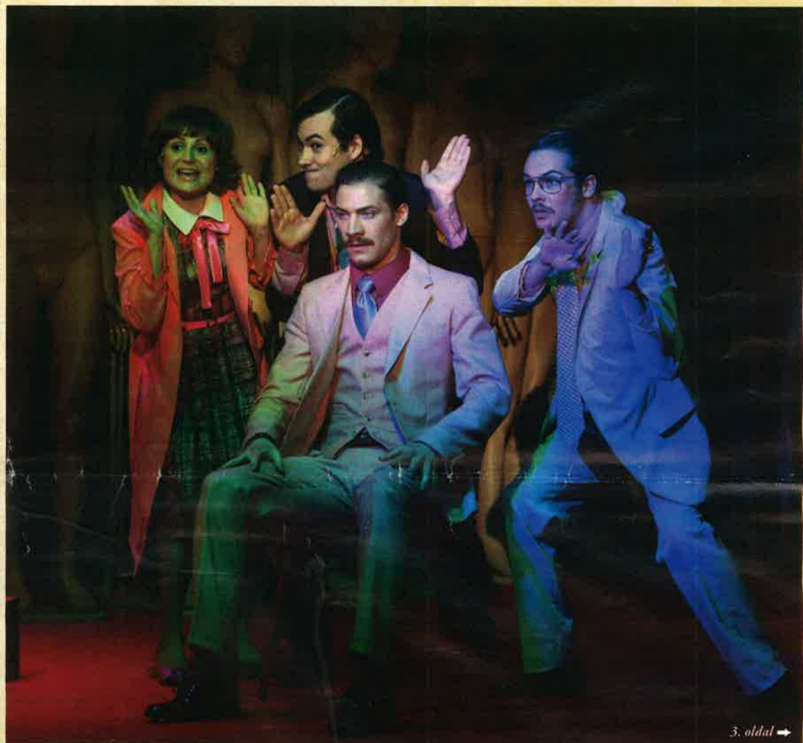
3. oldal →