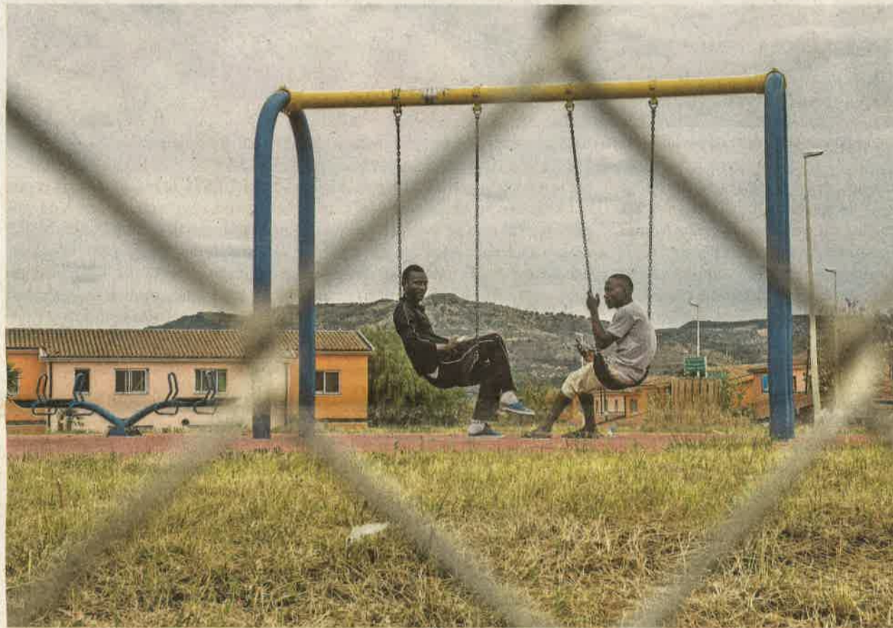
A zalaváriak nem akarnak menekültnyaralót a településükön