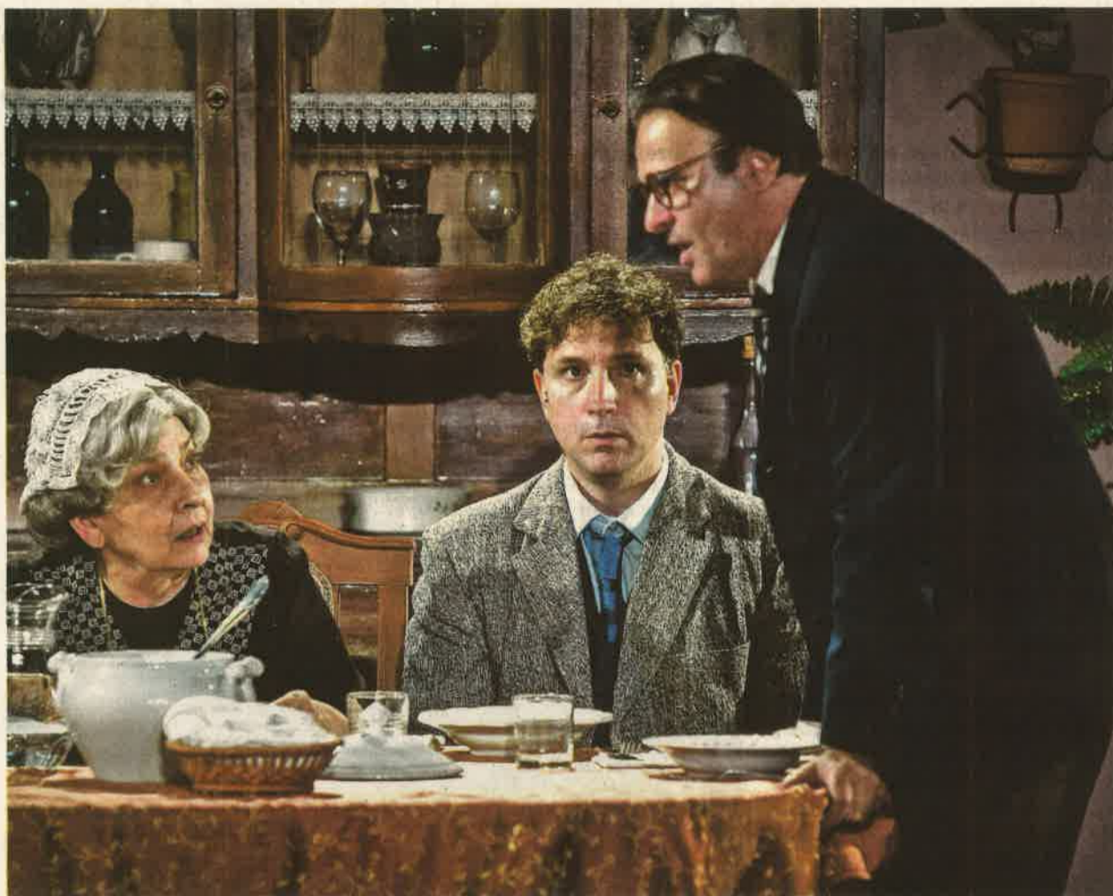
A csúcscsajelenet, az ökörködéssel szétvert vasárnapi ebéd valóságos burleszkszimfónia

A Lovagias ügy Virág könyvelő hányattatásainak története egy pofontól egy elmaradt párbajon keresztül a hepiendig: nagyobb látószögben sok vicces kisember (aki nagy ember akar lenni), két nagy ember (aki alig várja, hogy végre kisember lehessen) és az ügyne-