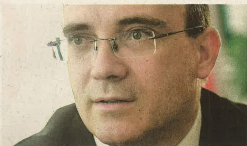
A mindennapi testnevelés bevezetése már eredményeket hozott. Idén újabb 20 tornaterem és 26 tanuszoda épül

Minden demokratikus társadalom oktatási rendszerében elengedhetetlen, hogy a lakosság felelőssége megjelenjen, amikor az ország védelmi képességéről van szó – mondta lapunknak adott interjújában Maruzsa Zoltán köznevelési helyettes államtitkár a hazafias és honvédelmi nevelés tervezett átgondolása kapcsán. Fontosnak nevezte, hogy az iskolai évek alatt szó essen az ezzel szorosan összefüggő hazaszeretetről. Ebben nincs semmi ördögtől való. Beszél arról is, hogy már érezte a hatását a kötelező testnevelésórák számának növelése: a Magyar Diáksport Szövetség által végzett mé-