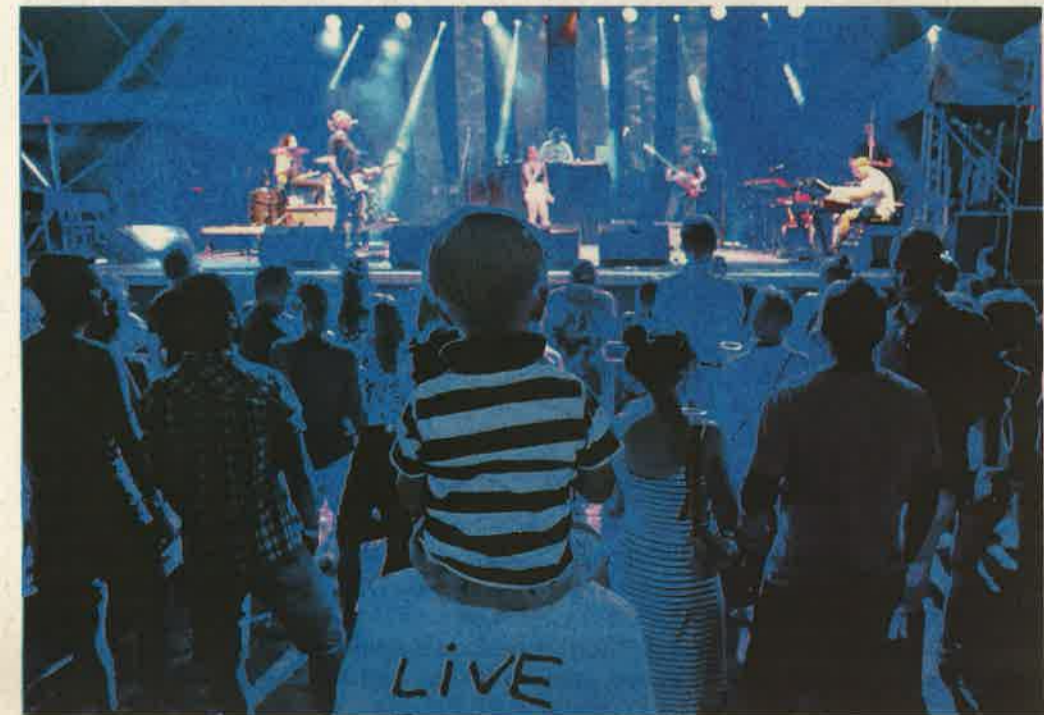
Négy színpadon húsz koncertet tartottak a dzsessz balatoni fővárosában