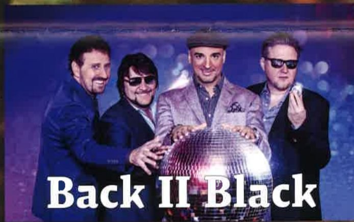
Back II Black