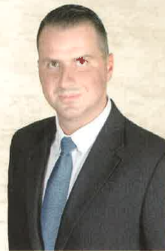
Balaicz Zoltán polgármester

Olvasgassák a műsorfüzetet, látogassanak el minél több rendezvényre, érezzék jól magukat családtagjaikkal, barátaikkal, ismerőseikkel együtt!