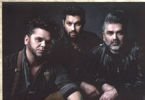
Magna Cum Laude