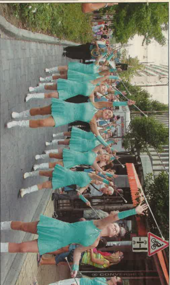
(Felvételünk a tavalyi Belvárosi Szüreten készülték.)

A fiataloknak pedig jó hír, hogy az Egerszég Fesztiválhoz hasonlóan ismét ingyenes wi-fi használat lesz a rendezvény területén, így a híss élményeit bárki megoszthatja barátáival és szeretteivel a világhálón.