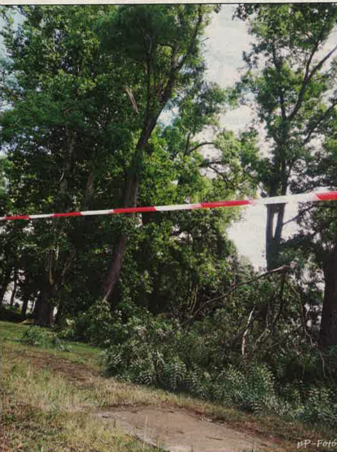
A körbekerített Rózsa liget.

Az elmúlt hét közepén rég nem látott vihar csapott le, és okozott károkat Zalaegerszegen. A szél fákat csavart ki, ágakat szakított le, vezetékeket tépett le és tetőket bontott meg városzerte. látvány helyenként meghökkenítő volt.