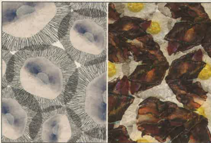
Balról növény minta, jobbról húsminta látható.

ben azokat a zöldeket kezdte el lerajzolni, melyeknek nagy a fehérje- és vastartalma (hiszen ezek a vegánok számára különösen fontosak). Mint mondja, a növényi rostokat festéssel érte el. Közben rájött, hogy ha egy lapon vegyíti a különböző színű, felvizezett temperákat, akkor azok ere-