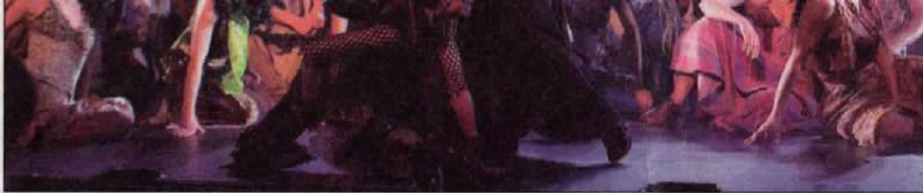
Látványos produkció várja az érdeklődőket.

találkozunk olyan előadással, melynek eseményeit, szereplőit rendezőjük modern környezetbe, új köntösbe helyezi. Mennyiben ragaszkodik az ExperiDance-koreográfia Arany János 1852-ben megírt művéhez?