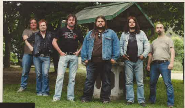
Shabby Blues Band

gója a csapatnak. A Napkutya zenekar lép színpadra, akiknek tavaly jelent meg Ugatni szabad című albumuk. Az alternatív együttes mindakadályozta meg őket abban, hogy bejárták az ország szinte valamennyi klubját, sőt nagyobb fővárosi színpadokra is eljutottak. Fűjön című dalukat több rádió is játszotta már.