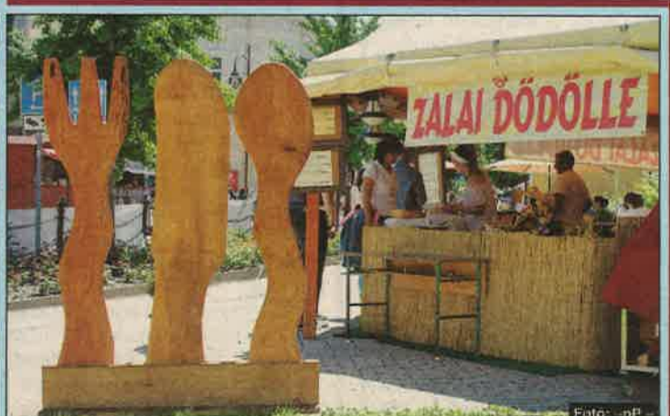
Felvételeink az elmúlt év fesztiválján készültek.