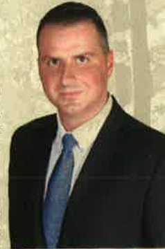
Balaiicz Zoltán polgármester

Zala megye hazánk legerdősültebb vidéke, úgy gondoltuk tehát, ideje megismerni az erdeink rejtette kincseket. Megtartjuk persze mindazt, ami bevált, ezúttal is számtalan standnál kínálják zamatos nedűiket a gazdák, nem maradhat el a díszpolgárok bora borverseny sem, és jobbnál jobb koncertek jelentenek ezúttal is kellemes kikapcsolódást, de számos bográcásban rotyognak majd a vadételek, sok más mellett erdei gomba, erdei gyümölcs, lekvár és méz is sorakozik majd a kóstolandó portékák között... Látogassanak el minél több rendezvényre, érezzék jól magukat családtagjaikkal, barátaikkal, ismerőseikkel együtt!