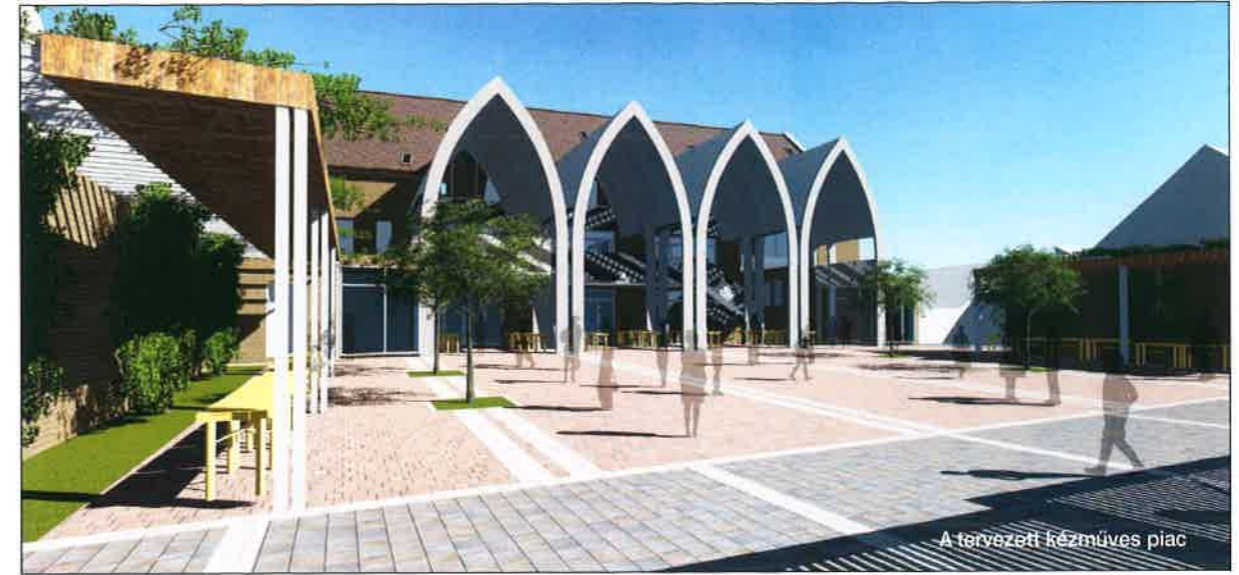
A tervezett kézműves piac

Nagy lehetőségek rejlenek a kertvárosi városrész melletti Alsóerdőben , melynek napközis táborát régóta szívesen használják a városlakók. Sajnos az elmúlt évtizedekben rossz állapotba került a létesítmény, így eljött az ideje, hogy megújuljon.