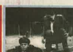
18.55 Kisváros A lakosságot mérgező gázkibocsátás miatt telepítik ki. Rádásul a veszélyeztetett területen ismeretlen holttestet is találnak...