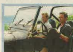
21.30 Hawaii Five-0 A helyi bünszervezet vezetője rájön, hogy egyik embere beépített zsaru. Elhatározza, hogy bosszút áll a férfi családján.

A MAO pályájának állomásai közül kiemelkedik Ennio Morricone és Michel Legrand filmzenéinek tolmácsolása Európa legnagyobb koncertteréneiben, a jazz nagyjai közül együttműködésük Dave Liebmannel , a Mezzofortéval, Kurt Ellinggel vagy Bob Mintzerrel .