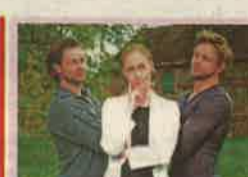
22.40 Zürös szívügyek Úgy tűnik, hogy Fritzi életében minden veszélybe kerül: a barátai, a bírók, egy emberélet és a szerelme is...