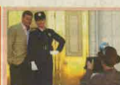
21.20 Dr. Csont A jó útra tért bűnöző ügye során Brennan és Booth újra közel kerülnek egymáshoz. Angela és Hodgins eldöntik, hogy Párizsba költöznek.