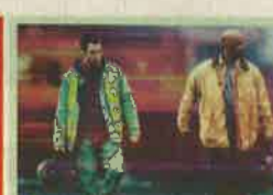
21.20 Száguldó bomba Elsza- badul egy mérgező vegyi anyagot szállító vonat. A veterán Frank és a zöldfülű Will mozdonyával a vonat után indul...