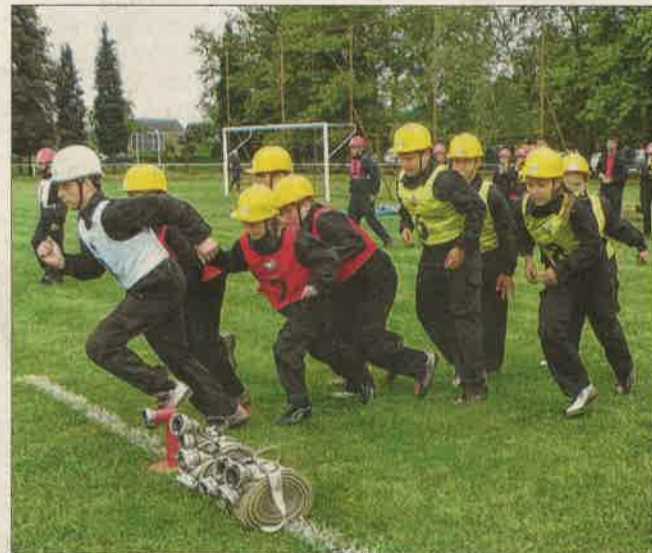
A letenyei ifjúsági csapat tagjai kiválóan szerepeltek