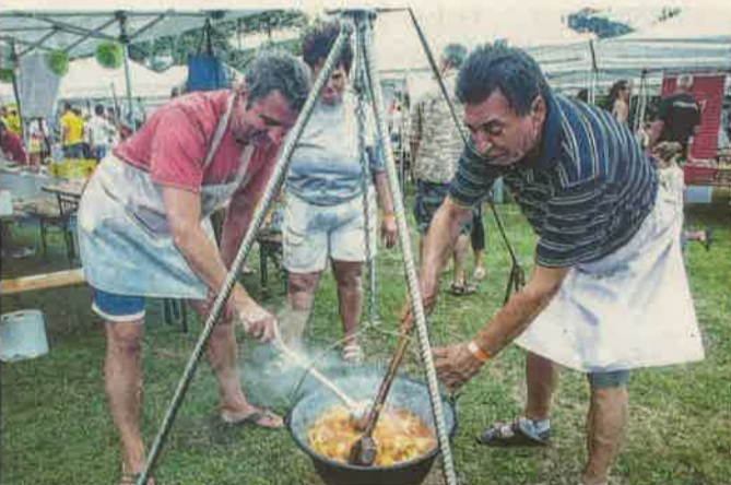
A főzserp a bográcsé volt, ami szinte minden közösségnél előkerült

A nap folyamán 2100 vendég fordult meg az AquaCityben, akik 932 ezer forintot fizettek belépőjegyre. A mindenkorban nagyobb számú, 64 főzőcsapat összes bevétele 1 millió 460 ezer forint volt, 44 cég pedig 3 millió 40 ezer forintot ajánlott fel (ez is rekord) a játékonysági célra.