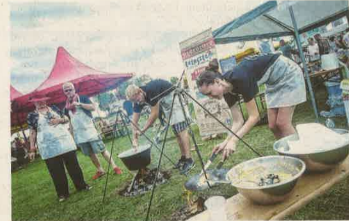
A Kvartélyház Kft.-nél felváltva főztek és sütöttek