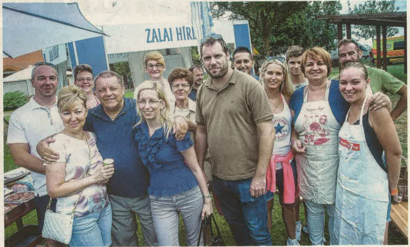
A Zalai Hírlap és a Zalaegerszegi 7 Nap közös csapata is kivette részét a játékonysági főzésből. Nagy sikere volt a bográcsos nyúlragunak és a grillezett húsnak. A zsűritől el is nyerte a csapat A grillezés királyai és királynői címet igazoló oklevelet.